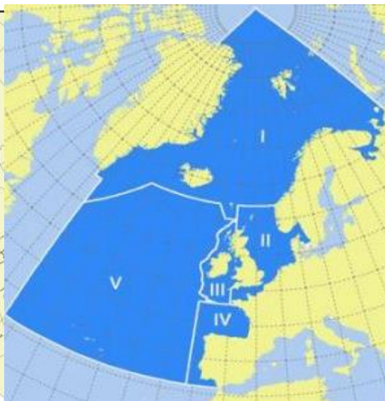
Schéma 5 : Mers subrégionales OSPAR